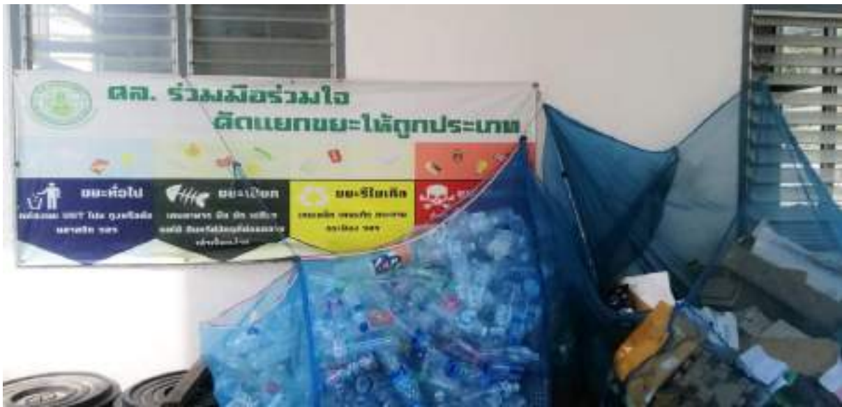
ภาพกิจกรรมคัดแยกขยะรีไซเคิลสร้างรายได้ยุค New Normal